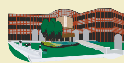
Административные здания, банки, офисы