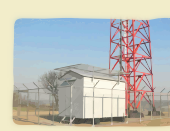
Базовые станции операторов сотовой связи