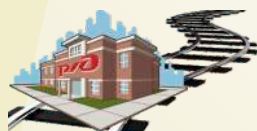
Оборудование объектов РЖД