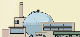
Производственные и промышленные объекты